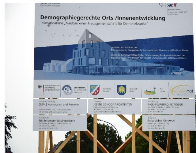
© EMM | Kommunen und Projekte

Die beiden ersten Projekte sind bereits im Bau, für die anderen steht der Bewilligungsbescheid kurz bevor.